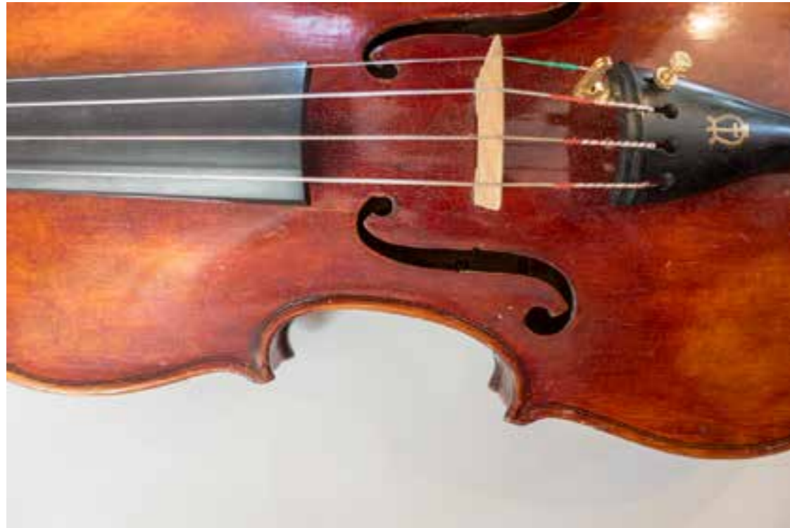
FOTO DEI PARTICOLARI